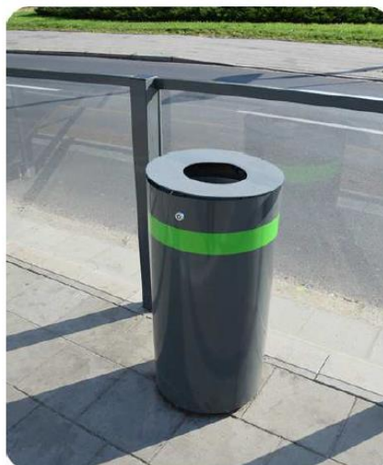
Ryc. 1 Poglądowy rysunek kosza na śmieci