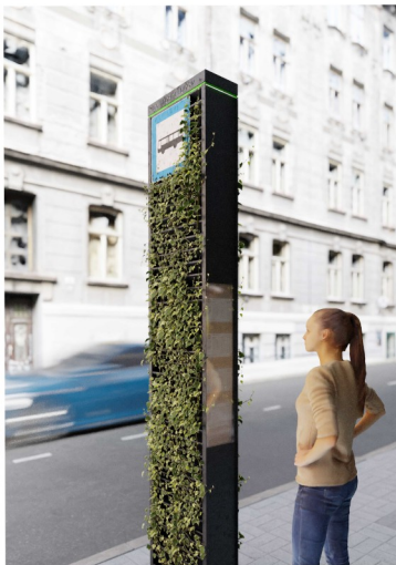
▷ Słup przystankowy przy Placu Wiosny Ludów w Poznaniu Widok na rozkład jazdy